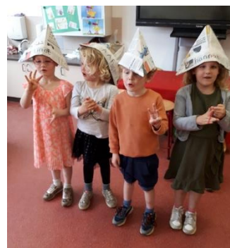
1,2,3,4 Hoedje van papier